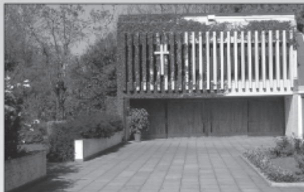
Capilla Pablo Nogués