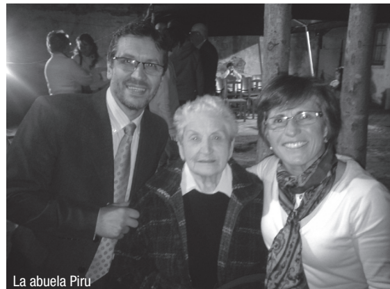
La abuela Piru